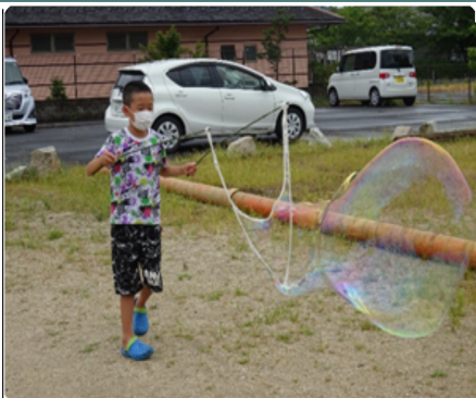
大きなシャボン玉を作る子ども達

暑い夏休みに水遊びやシャボン玉作り、スライム遊びは大人気。水風船を膨らませ、麻ひもや毛糸を巻き付け、ポンドで固め、風船をわって作った風船ボール。失敗しながらも、みんな鈴を入れて、風鈴ならぬ涼しげな飾りが