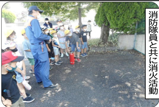
消防隊員と共に消火活動