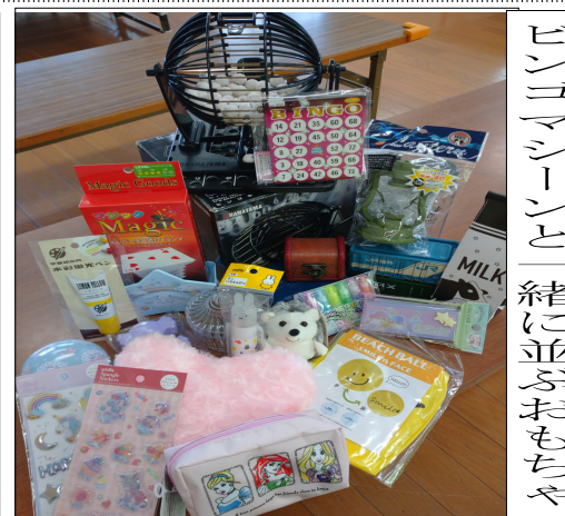
ビンゴゲームと糸に並ぶおもちゃ

な作品でいっぱいです。夏休みに入り7月は星のモビール作りが女の子達に人気で一人3~4個作る子も♡壁に飾って可愛いです。又、保護者から Legoのパーツをたくさん頂きました。色々な