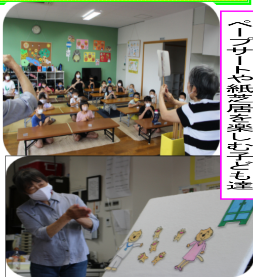
「てんとう虫」紙芝居を聴く子ども達

市北小学校の体育館をお借りし、“もくもくハウス”という、体に無害な煙で満たされた全長5メートルほどのテントを使った火災時の避難体験と、盛りだくさんの内容でした。講習で習った通り、煙を吸わないように頭を低く下げた体勢でテントから出てきた子ども達は「もう一回やりたい!」と大喜び。夏休みにしかできない貴重な体験ができました。