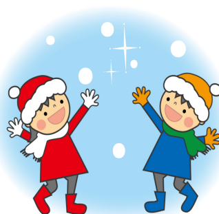
愛東南こどもの家