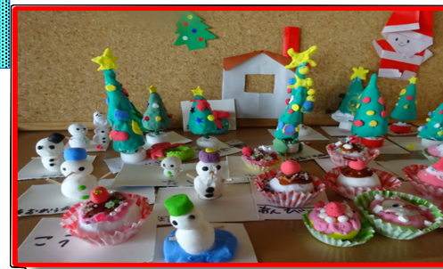
湖東第三こどもの家

粘土は失敗しても、また形を作り変えられる素敵な遊びです。クルクル丸めて重ねるだけでかわいいスノーマンに！バケツや枝はオリジナル。まん丸に丸めるだけでできるかわいいカップケーキ。そこにおいしいそうなクリームやサクランボ。クリスマスツリーも細長さんにジャンボさんと、個性がでておもしろかったです。みんな楽しく作りました。玄関に飾るとクリスマスのかわいい飾りになりました。緑色がなくなり、青色と黄色を混ぜて作る子。少し考えられるように声をか