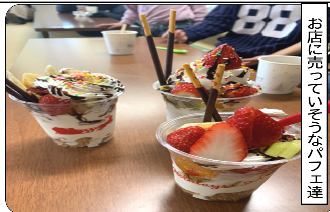
お店に売っていきそうなパフェ達