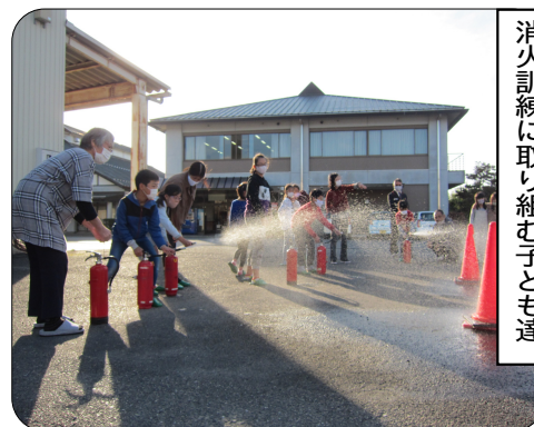
消火訓練に取り組み子ども達