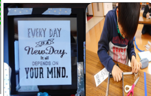
フォトフレームを作る男の子

フォトフレームに、シールやマスキングテープをお友達とも相談しながら考えて貼り、デコレーションをして楽しんで作り上げました。男の子も思ったよりこだわって、フォトフレームの裏にもシール貼ったりして一生懸命に仕上げている姿も見られました。また、これらを「お家の人にクリスマスプレゼントするー！」という子どももいて、学童保育所もクリスマスモードで盛り上がりました。また、完成したフォトフレームを玄関に飾り、保護者さんにも見て頂くこと