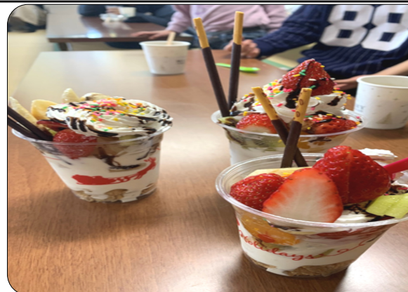
お店に売っていきそうなパフェ達