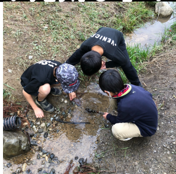
小川で生き物を探す子ども達

「おお！ちっちゃいカニがおる！！」12月の寒空の下で、今日も山上こどもの家の子ども達の元気な声が響き渡ります。子ども達が通う山上小学校は、最近ではなかなか見ることのできない、グラウンドのすぐ横に山がある学校で、校舎の脇を流れる小川にはカニやイモリなどが潜んでいます。大自然の中を走り回る子ども達(特に男の子)はみんな生き物が大好き。冷たい水に手を入れて、時には袖を濡らしながら生き物観察に夢中です。その他にも、半袖のシャツでサッカーをしている子もいたり、ブランコに乗って靴飛ばしをしている子もいたり、寒い外でも笑いの絶え