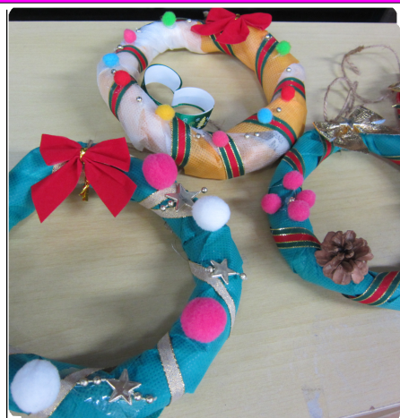
オリジナルリース作り

そこで、支援員があらかじめ用意した(新聞紙を使って、不織布を巻いたもの)リースに、子ども達それぞれのオリジナルリースづくりを企画しました(パーツは100均素材を利用)。何回かに分けて取り組み、一人ひとり素敵なリースが出来上がると、「先生、見てこれはサンタさんにあげる」「弟の誕生日もうすぐやし、プレゼントにする」など・・・みんなの気持ちが込められています。学童の部屋もリースでかわいいです。ほとんどの子が2個