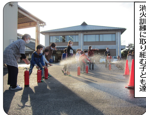
消火訓練に取り組み子ども達