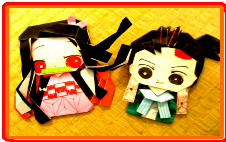
「鬼滅の刃」の竈門炭治郎と竈門禰豆子

10月16日に「鬼滅の刃」の映画が上映開始になり、ますます鬼滅の刃の人気が高まっています。布引第Ⅰ・Ⅱこどもの家でも人気になってきました。最初はぬり絵をしているだけでしたが、一人の支援員がキャラクターの人形を作ってきた事から、その支援員の周りに毎日子ども達が集まり人形作りが始まりました。以前はポケモンの人形（既製品）を使って遊んでいた子ども達も自分達で鬼滅の刃のキャラクターを作ったり支援員が手作りした人形を使って戦わせたりして、ごっこ遊びをしています。学年を問わず人気で低学年はぬり絵をよくしていて、キャラク